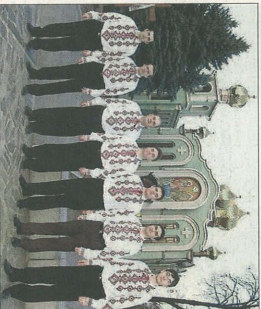
Kirkkolauluyhtye Kaanon esiintyy Pernajan kirkossa 16.11.

Kuoro sai alkunsa 1990-luvun alussa, kun setsenään