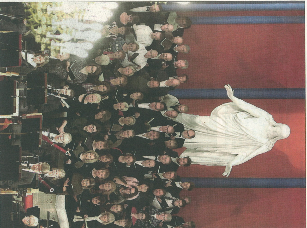
Kuoro ylsi vaikuttavaan suoritukseen.